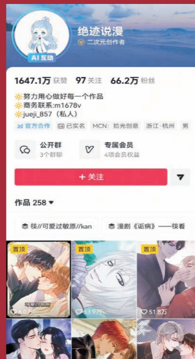
新媒体学生独立运营动漫解说账号“绝迹说漫”，拥有66万粉丝