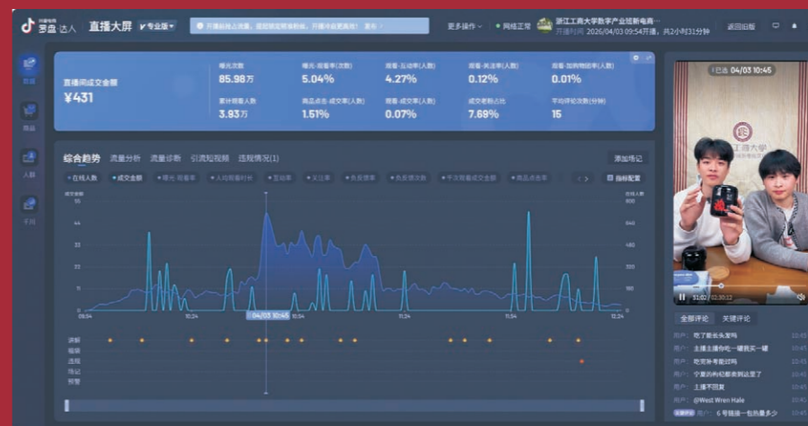
从模拟直播到实景上播落地