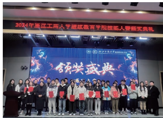
技能大赛颁奖典礼