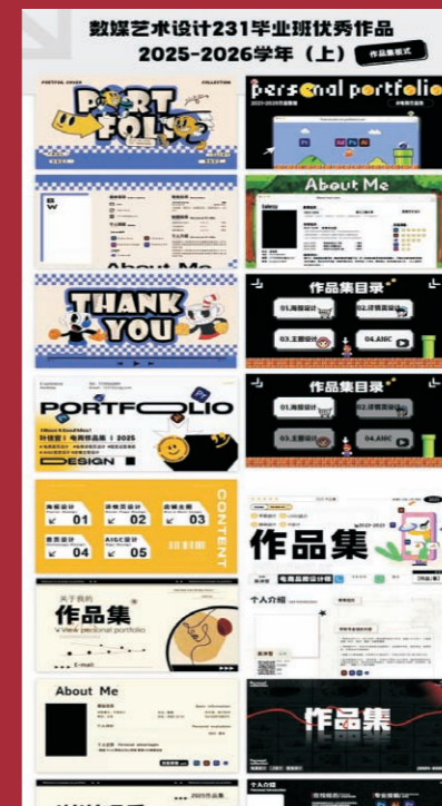
数媒艺术设计23级毕业班优秀作品