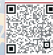
招生咨询微服务号