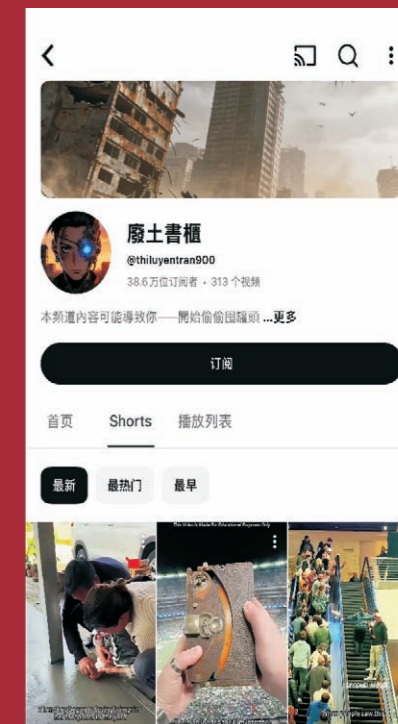
新电商学生独立运营YOUTUBE海外账号“土”，拥有38.6万订阅