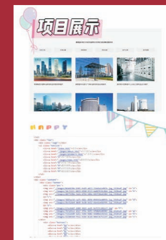
网页开发项目展示