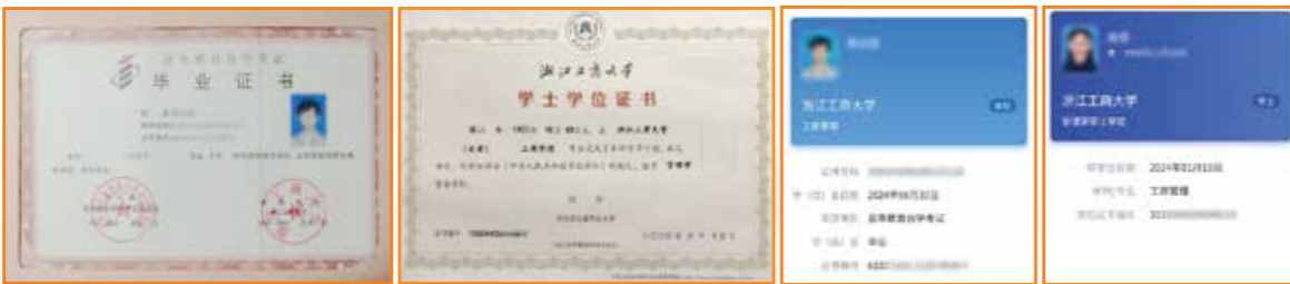
自考本科毕业证书